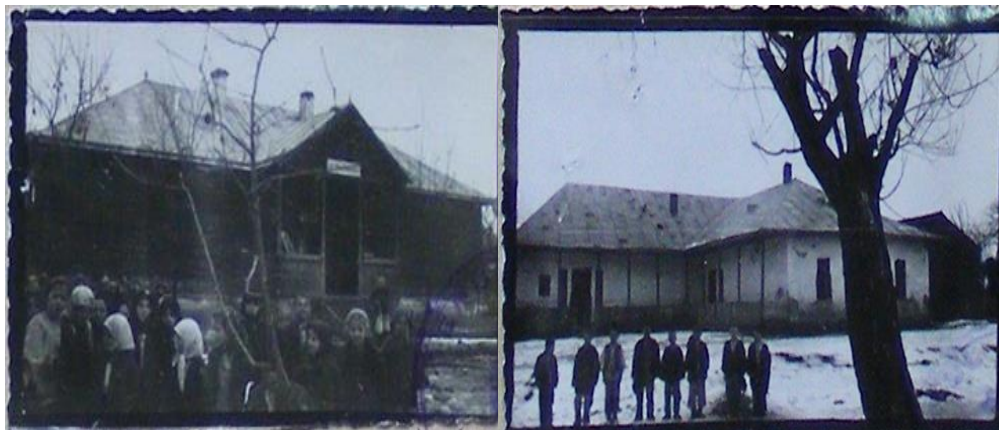
Fig. 2. Școala nr.2 Săliștea de Sus, construită în 1908.

învățământ și o cancelarie iar cea de-a doua are două săli de învățământ și două încăperi și dependințe pentru locuința învățătorului 54 .